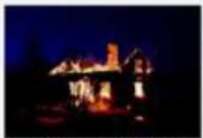
Övertänd. Den stora branden var bräddad och stoppades av brandenheten i stadsbrandväsendet.