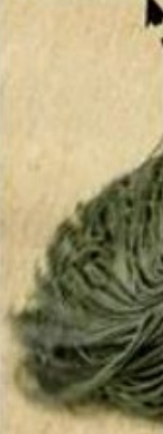
Skatt. Så här ser utskriften ut.