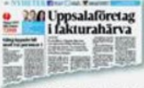
23 december 2015. UNT skrivs om en skattehärla på städfirmans ägarfamilj.

SKATTER. Uppsalas kommun anlitade en städfirma som senare blev tvivelsfull. Kommunens städjobb har blivit ett stort skatteproblem.