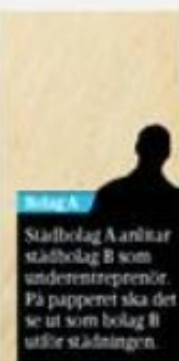
Stadsbolag A anlitat stadsbolag B som underentreprenör. På papperet ska det se ut som bolag B utför städningen.