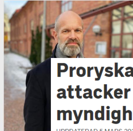
Så kan patientuppgifter i Sörmlandsregionens videoöppet.